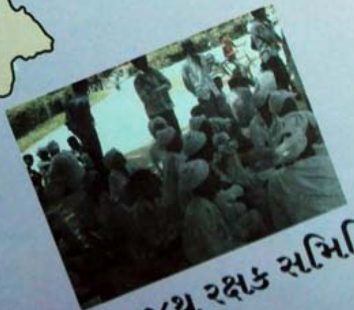
લોકજૂથ રક્ષક સમિતિ